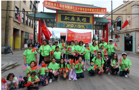
师生参加庆祝游行